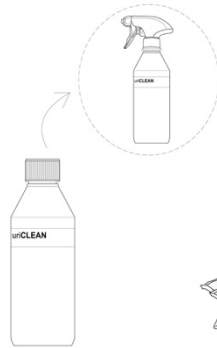
1 x uriCLEAN 0,5 L